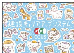
重本 結愛 様