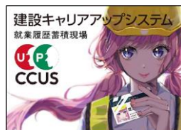
福嶋 里紗 様